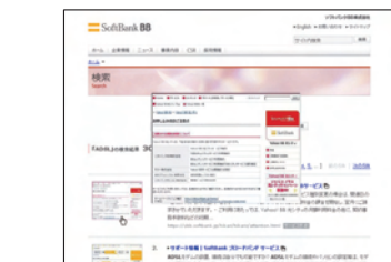
「ADSL」の検索結果。サムネイルにカーソルと近づけるとポップアップ拡大表示される

ソフトバンク BB 木戸氏 (以下、S) ユーザビリティ向上のために導入した点は、当社も同じですね。当社の場合グループ内に、通信サービスを展開するソフトバンク BB、ソフトバンクモバイル、ソフトバンクテレコムが3社ありますが、それぞれが異なるコーポレートサイトとサービスサイトを持つ構造になっています。3社間で共同提