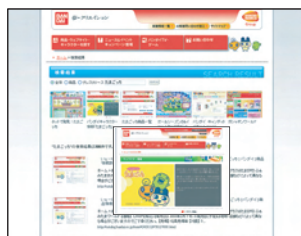
「たまごっち」の検索結果 (公式サイトの結果) © BANDAI・WiZ 2004

バンダイの商品は「たまごっち」ひとつを取っても、液晶ゲームから食玩、アパレル商品など多岐にわたって展開されています。そのため、親御さんがお子さんへのプレゼントを探している場合など、文字だけの検索結果ではどれが目的の商品を紹介したページなのか、すぐにわからないことがあるんです。サムネイル画像が出れば「CM